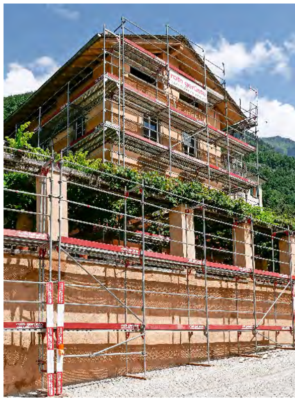
Die Villa Garbald, Baujahr 1863, mit Stützmauer und Pergola. Die Villa besticht durch verschiedenfarbige Putze und der Kombination von Fenstersimsen aus Granit und anschliessenden Bauteilen in raffinierter Imitationstechnik. Jon Duschletta

1863, also vor 161 Jahren, wurde mit dem markanten Bau der Villa Garbald begonnen. Architekt war kein geringerer als der Deutsche Gottfried Semper (1803–1879), der sich als Kunsttheoretiker, vor allem aber als Architekt und Vertreter des Historismus und der Neorenaissance wie auch als Mitbegründer der modernen Theaterarchitektur weltweit einen Namen gemacht hat. Dabei bildete die Villa Garbald – einem der geographischen Lage des abgelegenen Bergells angepassten Baus in lombar-