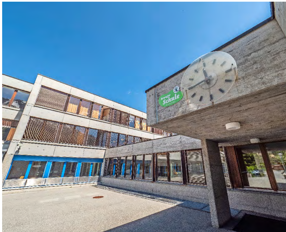
Schüler von Sils, Silvaplana und St. Moritz besuchen die Oberstufe im Schulhaus Grevas. Eine Initiative verlangt, dass diese auch bei einem Schulverband in St. Moritz bleiben soll. Aber nicht zwingend in Grevas.