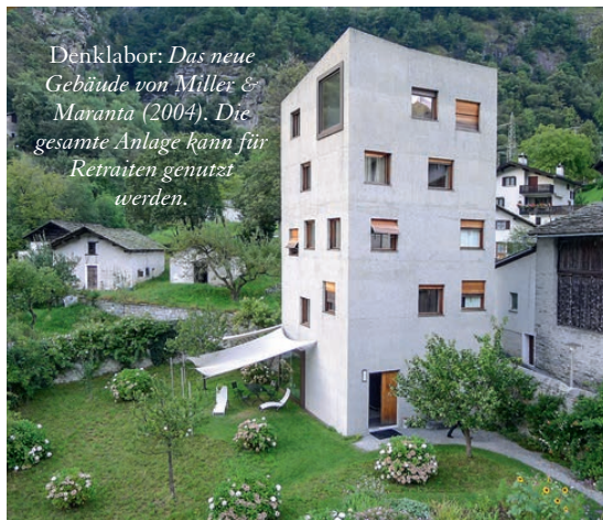
Denklabor: Das neue Gebäude von Miller & Maranta (2004). Die gesamte Anlage kann für Retraiten genutzt werden.

Kontakt: betriebsleitung@garbald.ch weitere Infos unter: www.garbald.ch